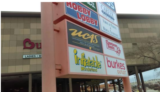
San Antonio (4522 Fredericksburg Road, A-85)