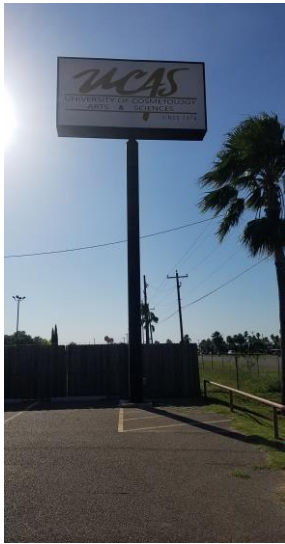
La Joya, TX