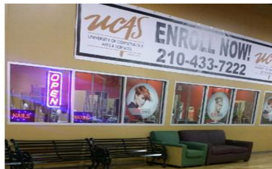
San Antonio (Pica)