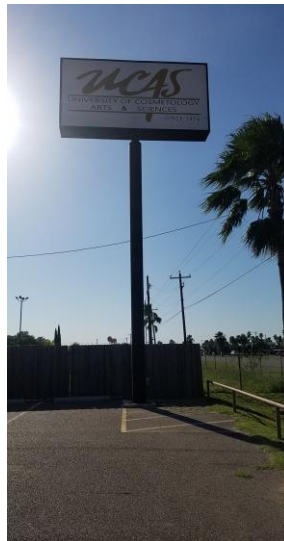
La Joya Campus