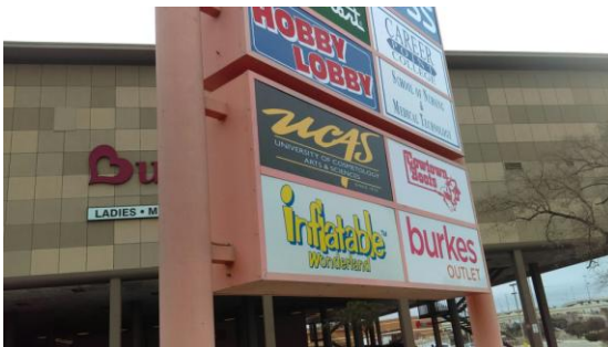
San Antonio (410)