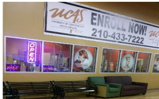
San Antonio (Pica)