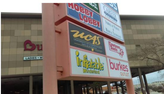
San Antonio (410)