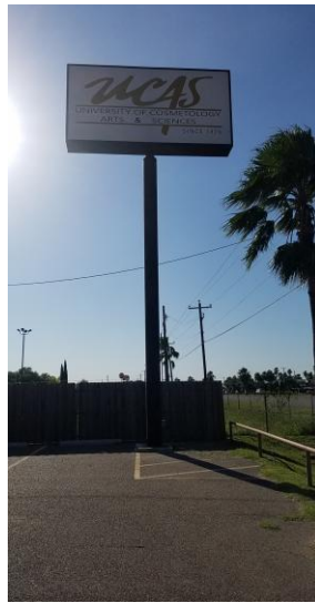
La Joya Campus