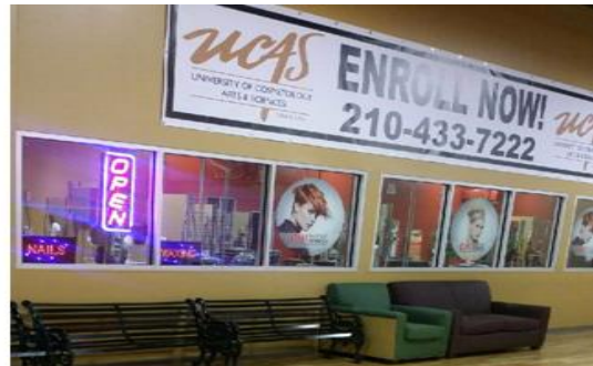
San Antonio (Pica)